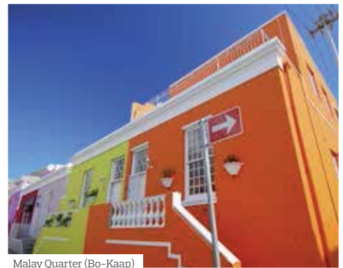
Malay Quarter (Bo-Kaap)