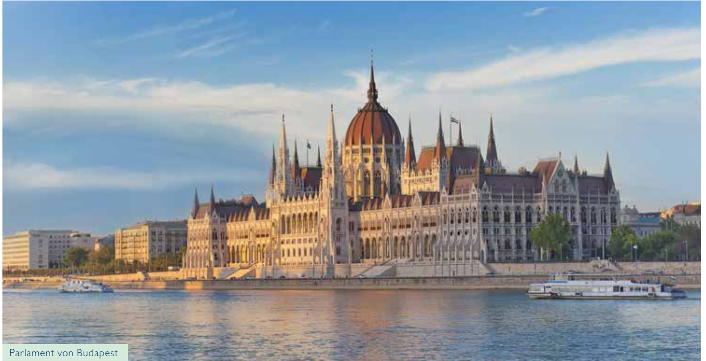
Parlament von Budapest

Reise-Nr. ELE 25 /17 · 7 Tage vom 21.09. bis 27.09.2017