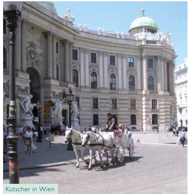
Kutscher in Wien