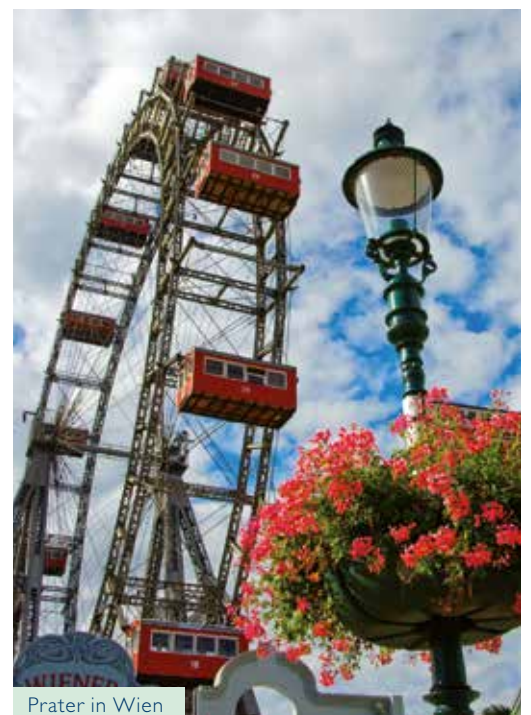
Prater in Wien

Am legendären Donauknie in Ungarn fast rechtwinklig nach Steuerbord abgebogen, werden Sie gen Abend von Tausenden Lichtern begrüßt: Ob Heldenplatz, Nationaltheater oder Kettenbrücke – ganz Budapest erstrahlt in voller Pracht und lässt Sie in längst vergangenen Zeiten schwelgen. In Bratislava winken Ihnen dann die stolze Pressburg und die goldgekrönte Turmspitze des Martinsdoms noch einmal zu, bevor Sie wieder in Österreich anlegen. Bummeln Sie im malerischen Dürnstein direkt am Donau-Ufer entlang bis zum himmelblauen Kirchturm, verlieben Sie sich auf der mittelalterlichen Burgruine in die fantastische Aussicht über die herbstliche Wachau oder besuchen Sie das barocke Stift Melk. Unter dem üppigen Deckengemälde im eleganten Marmorsaal federleicht im Kreise gedreht, fühlen Sie sich wie in guten alten Zeiten.