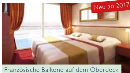
Französische Balkone auf dem Oberdeck