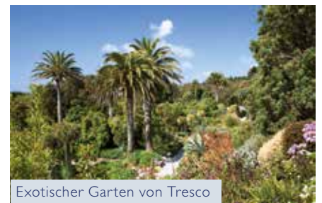
Exotischer Garten von Tresco

Programm- und Preisänderungen vorbehalten.