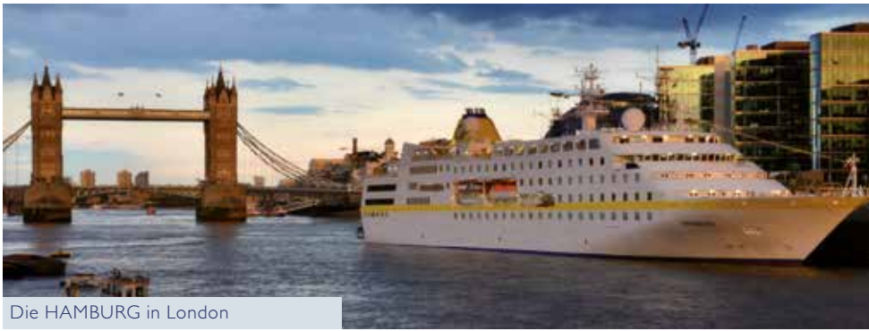
Die HAMBURG in London