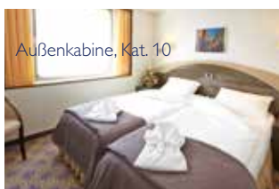
Außenkabine, Kat. 10