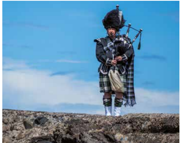
In Schottland hat der Dudelsack eine besondere Tradition