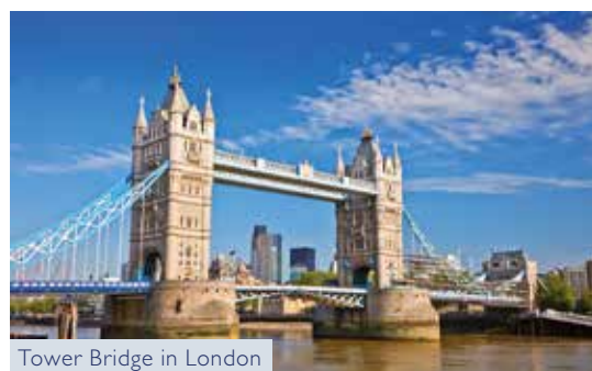
Tower Bridge in London