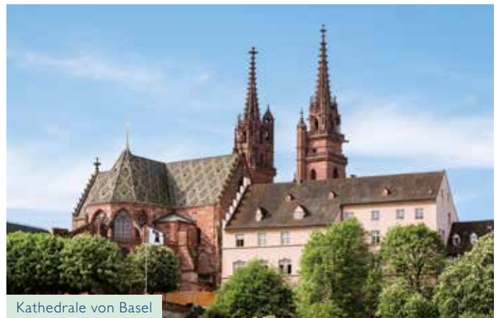
Kathedrale von Basel

Die Weinberge erstrahlen in sattem Grün, die Wiesen duften wie ein Blütenmeer – während Sie in Koblenz mit der Seilbahn zur Festung Ehrenbreitstein schweben, erleben Sie einen grandiosen Blick über Stadt und Land. Und was der „Romantische Rhein“ verspricht, das hält er auch: Gerade haben Sie die zauberhafte Loreley bei Rüdesheim passiert, da schreiten Sie in Speyer auch schon andächtig über die ehemalige Prachtstraße Via Triumphalis bis zum Kaiser- und Mariendom – wie einst die römisch-deutschen Kaiser und ihr Gefolge.