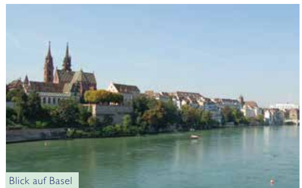
Blick auf Basel